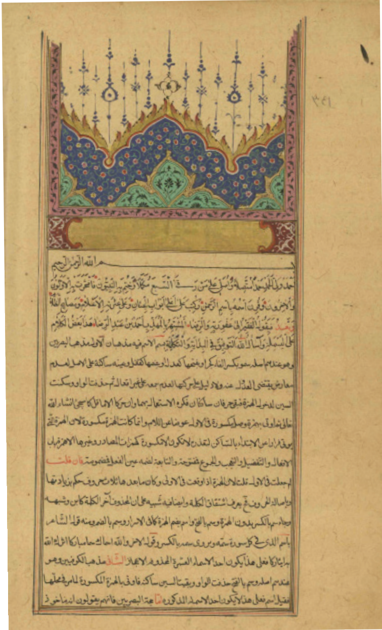
الصفحة الأولى من المخطوطة